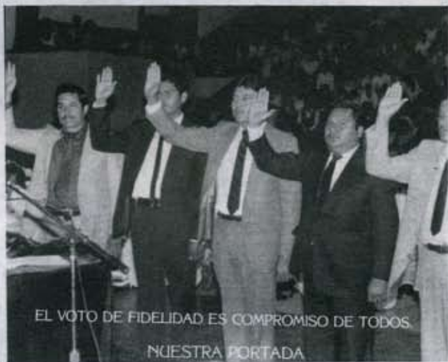
EL VOTO DE FIDELIDAD ES COMPROMISO DE TODOS NUESTRA PORTADA