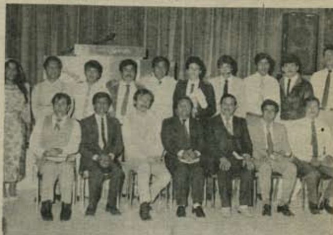
El primer grupo de Estudiantes del Seminario de Occidente con sus Maestros.

Existen planes para hacer una considerable inversión en el futuro inmediato en la especialización de por lo menos una base de 6 maestros, además, ya se está pensando aplicar en la adquisición de un terreno para la construcción de edificios apropiados, parte de un crédito que el Distrito obtuvo para el funcionamiento del Seminario.