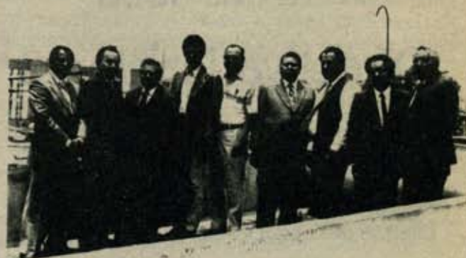
Los estudiantes del último ciclo del ITAI con su Maestro.

A partir de la administración 1986-1990, nuestro Instituto Teológico Apostólico Internacional principio a brindar servicio a los profesores de los Centros Distritales de Educación Permanente.