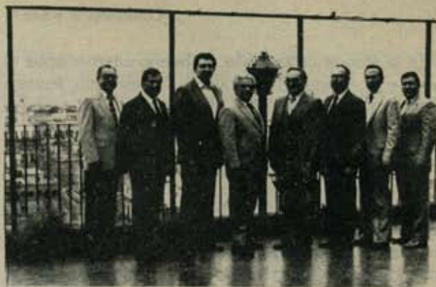
Mesa Directiva Nacional 1986-1990

2.- Se propuso que la Convención General Ordinaria que corresponde celebrar en el próximo año de 1988 sea de carácter exclusivamente ministerial. La propuesta fue aprobada, tomándose el acuerdo de que esta convención se celebre en la Cd. de Torreón, Coah., los días 5 al 8 del mes de Abril de 1988.