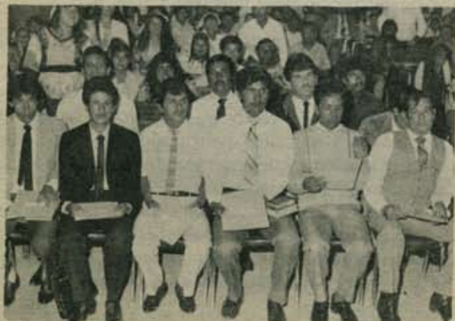
Satisfechos de concluir su estancia en el Seminario de Occidente los alumnos del primer ciclo de clases reciben su constancia de estudios.

Las materias que se imparten en este Seminario son: Homilética, Hermeneutica, Constitución, de la Iglesia, Consejería Discipulado y Liderazgo entre otras no menos importantes.